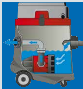
Ansaugen und Abpumpen in einem Arbeitsgang