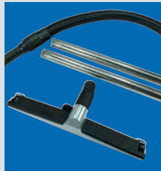
inklusive umfangreichem Zubehör