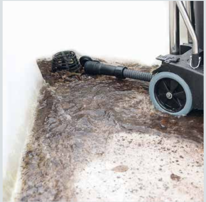
Ablass-Schlauch zur restlosen Entleerung des Behälters