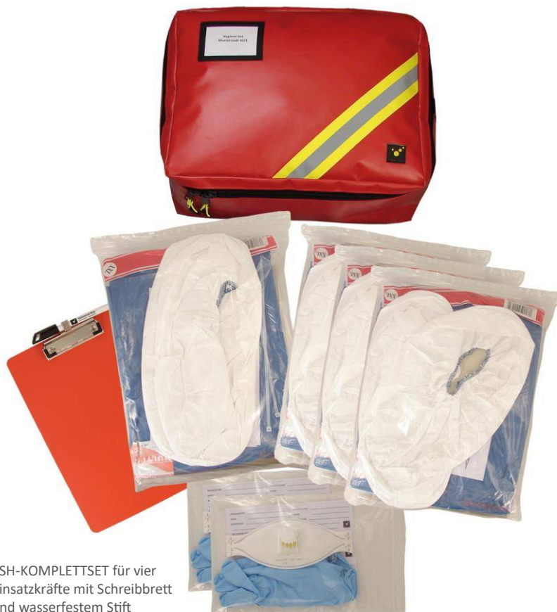
ESH-KOMPLETTSET für vier Einsatzkräfte mit Schreibbrett und wasserfestem Stift