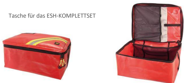
Tasche für das ESH-KOMPLETTSET