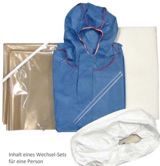
Inhalt eines Wechsel-Sets für eine Person